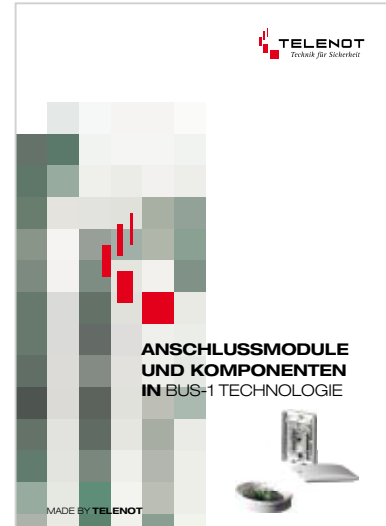
Prospekt „BUS-1 Module“