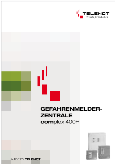
Prospekt „complex 400H“