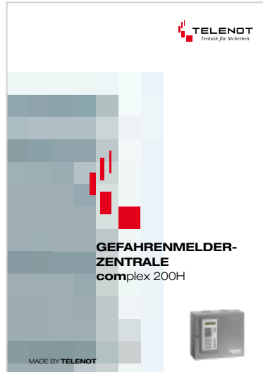
Prospekt „complex 200H“