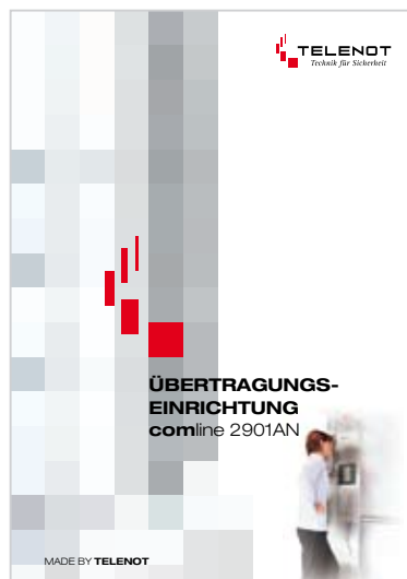
Prospekt „comline 2901AN“